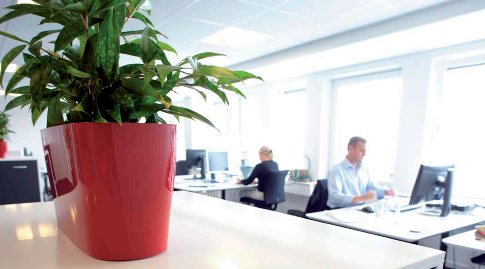
Interiør fra 2C change a/s' kontor i Hvidovre