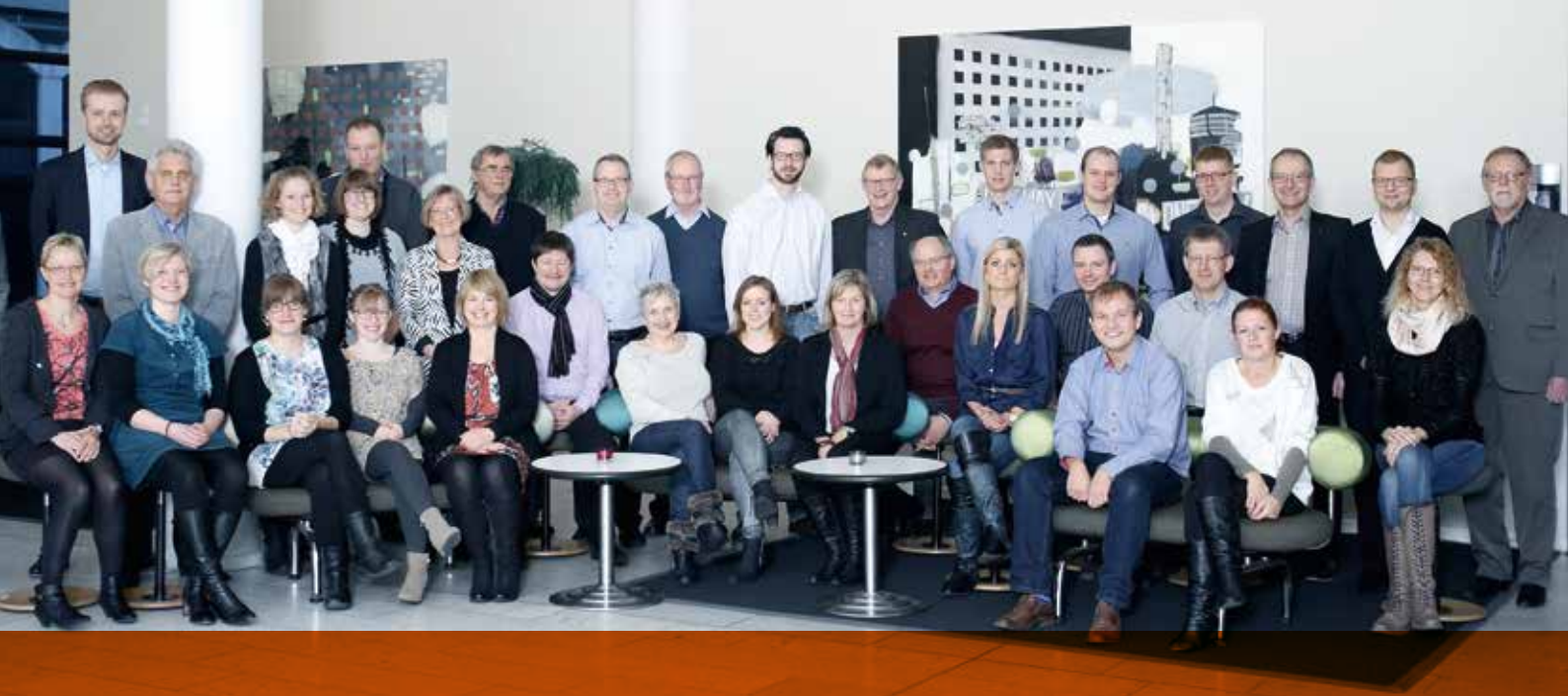
Beierholm-medarbejdere i Region Syddanmark, hvor selskabet har udvidet markant med kontorer i Kolding og Vojens.

Hertil kommer, at Beierholm løbende udvikler og gennemfører faglige og personlige kurser, som både tilgodeser medarbejdernes individuelle og kollektive behov for udvikling i forhold til deres kompetenceområder, anciennitet og ønsker.