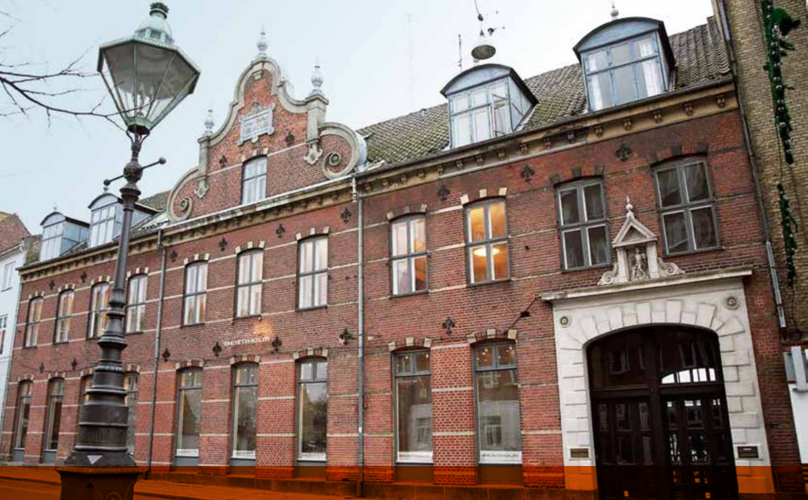
Beierholms kontor i Nykøbing Falster.